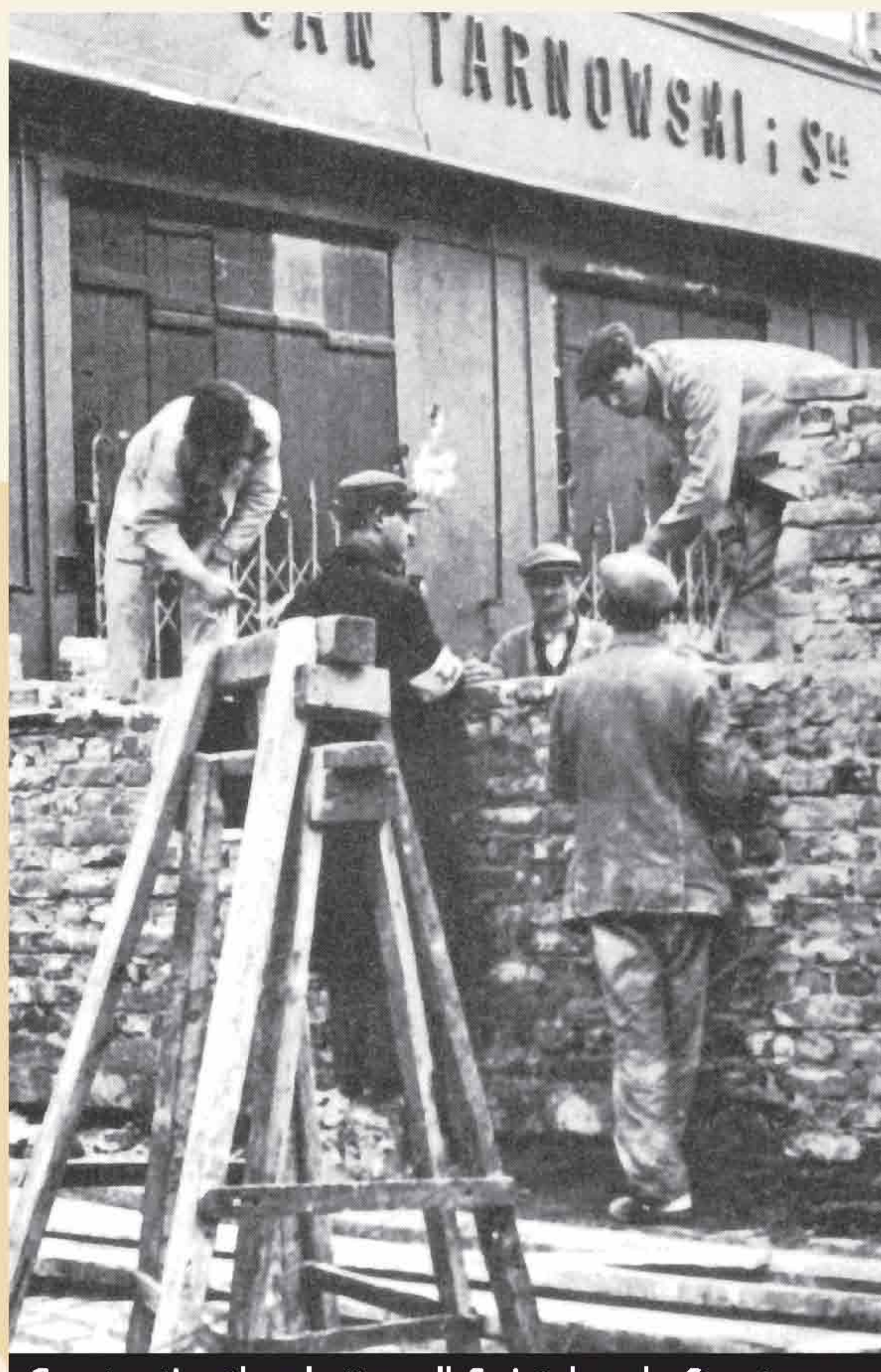
Constructing the ghetto wall, Swietokrzyska Street.

เกิดโตแห่งกรุงวอร์ซอว์ เมืองหลวงของโปแลนด์ ถูกสร้างขึ้นเมื่อ พ.ศ. 2483 ชาวยิว 5 แสนคนถูกกวาดต้อนเข้าไปอยู่ภายในกำแพงสูง 10 ฟุต ที่มีขอบเป็นเศษแก้วและลวดหนาม สภาพความเป็นอยู่ทำให้มีคนตายรายวันทั้งจากโรคและจากการขาดอาหาร เมื่อไรน์ฮาร์ดต์เพิ่มปฏิบัติการกำจัดชาวยิว เมื่อ พ.ศ. 2485 ชาวยิวจากวอร์ซอว์ ถูกส่งไปยังโรงฆ่าในค่ายกักกันเทรบลิงกา (Treblinka) เป็นจำนวน 3 แสนคน อีก 5 แสนคนเหลืออยู่เพื่อเป็นทาสแรงงาน ในที่สุดพวกยิวก็เริ่มต่อสู้ในซีในปีพ.ศ. 2486 และทำให้เกิดโตแห่งวอร์ซอว์ถูกทำลายราบเป็นหน้ากลอง