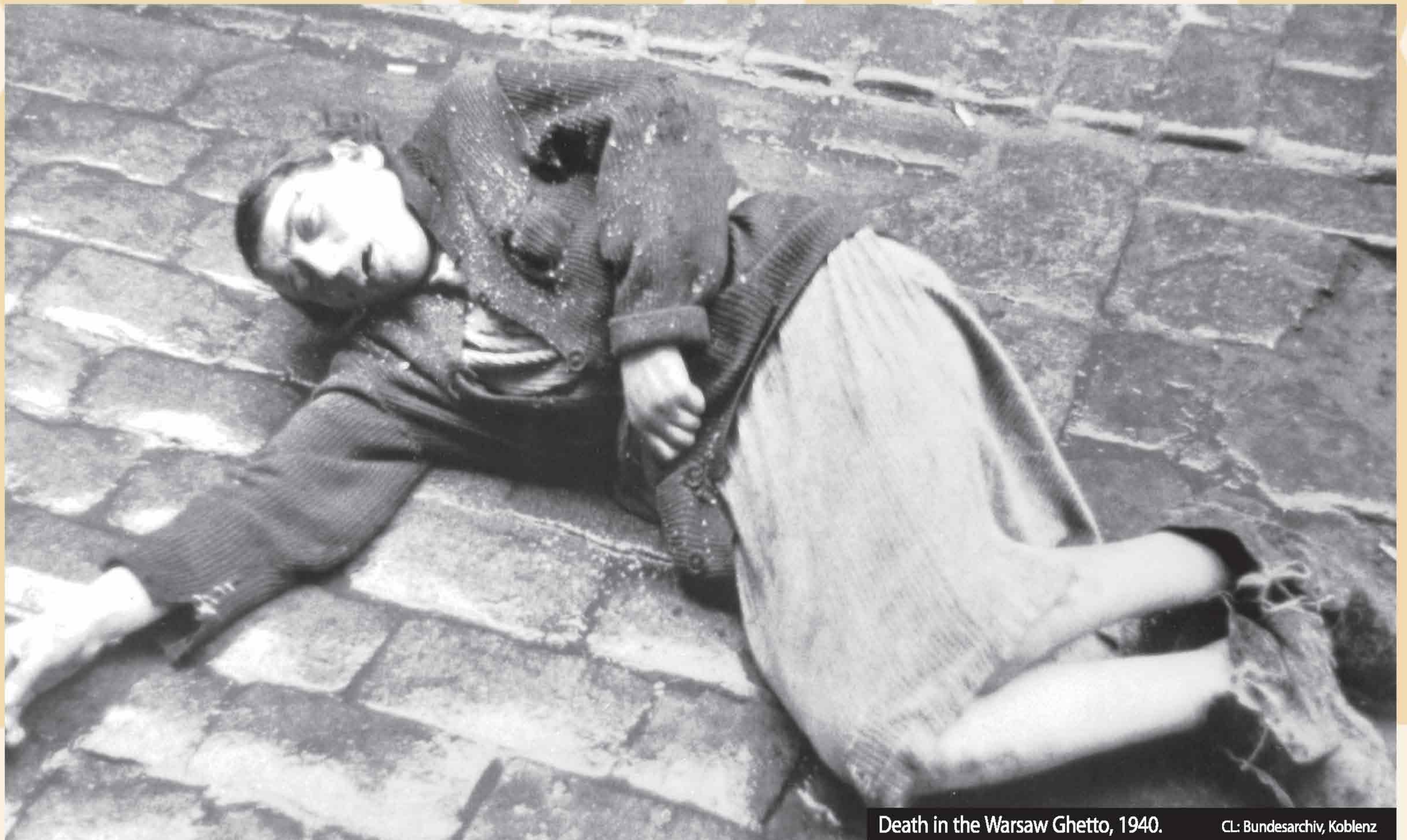
Death in the Warsaw Ghetto, 1940.

THE WARSAW GHETTO WAS OFFICIALLY ESTABLISHED ON OCTOBER 2, 1940. Surrounded by a 10 foot high wall topped with broken glass and barbed wire, the ghetto population contained nearly 500,000 people. Overcrowding, malnutrition, and disease caused daily fatalities in the ghetto. In 1941 alone, nearly 40,000 died of disease and starvation. Death by “natural means” was deliberate policy for the ghettos. During the Operation Reinhard liquidation, from July through September 1942, nearly 300,000 Jews were deported from Warsaw to the killing center at Treblinka. Only 50,000 Jews able to work remained in the ghetto. On the eve of Passover, April 19, 1943, Jews in the Warsaw Ghetto rose in revolt. After 27 days of resistance, “the ghetto was no more.”