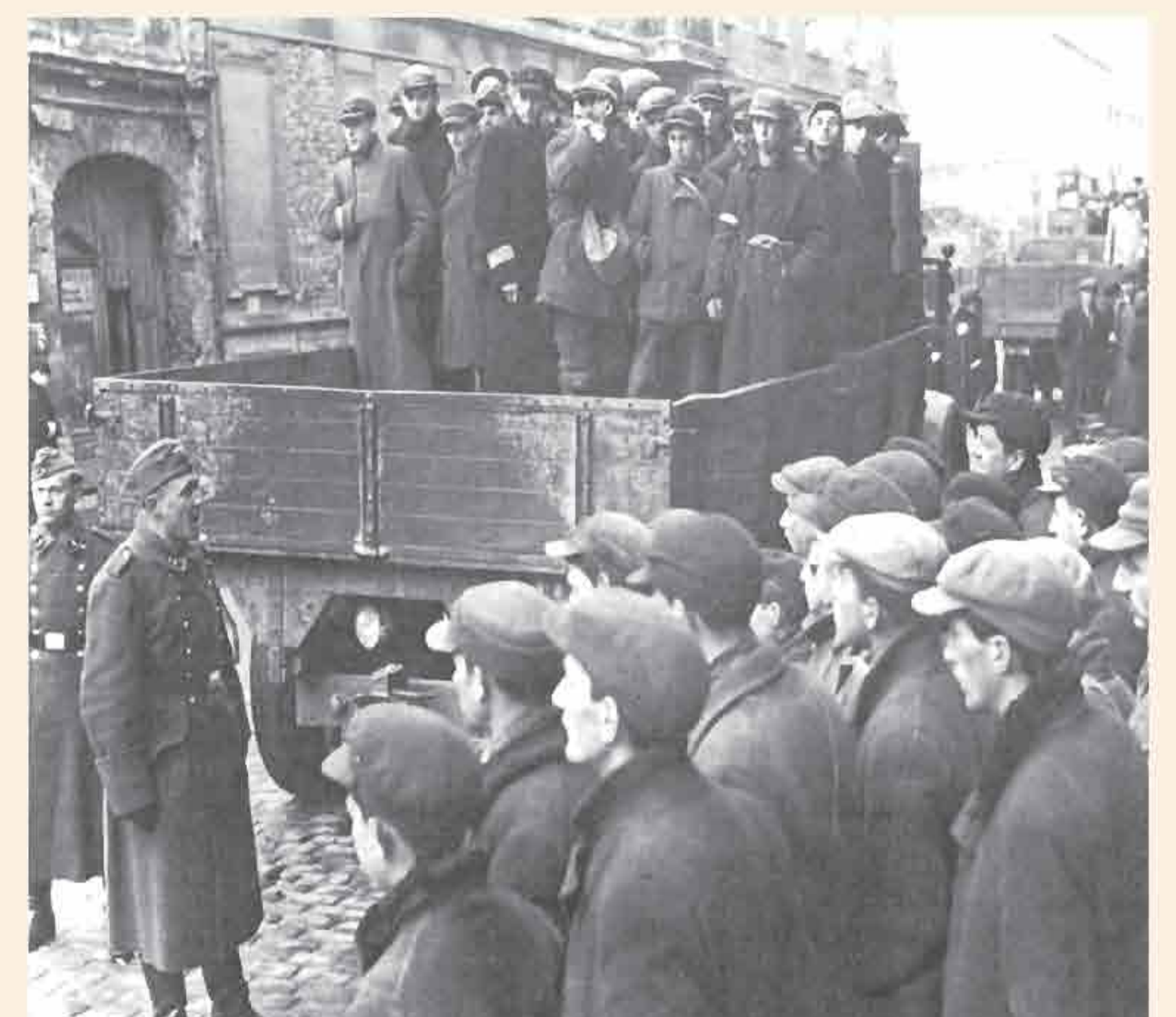
Transport to forced labor site outside the ghetto.

“The Jewish quarter extends over... 1,016 acres... Occupancy, therefore, works out at 15.1 persons per apartment and six to seven persons per room.”