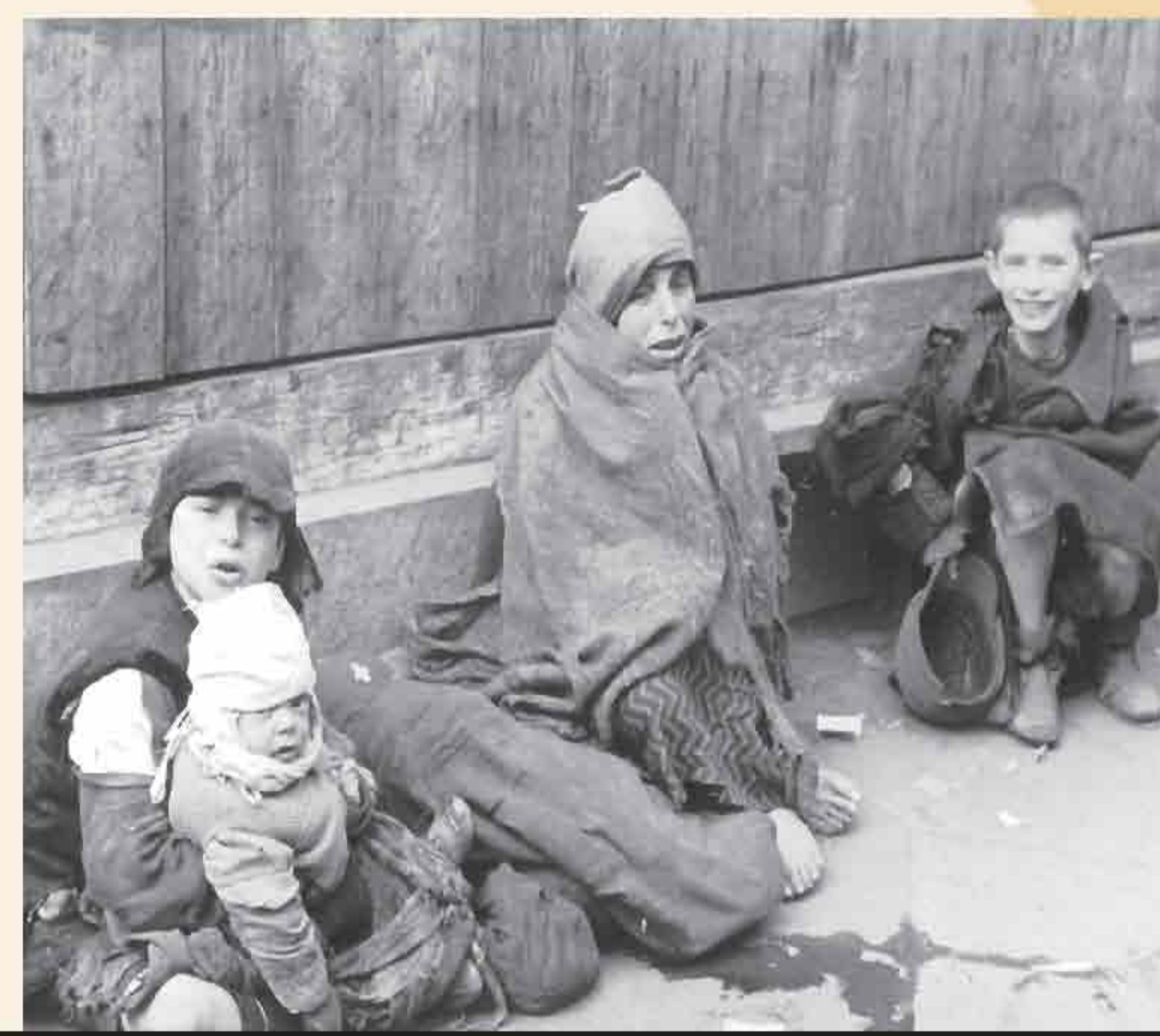
In the streets, hungry and homeless.

“Whoever will endure, whoever will survive the diseases that range in the ghetto because of the dreadful congestion, the filth and uncleanness, because of having to sell your last shirt for half a loaf of bread. Whoever will be that hero, will tell the terrible story of a generation and an age when human life was reduced to the subsistence of abandoned dogs in a desolate city.”